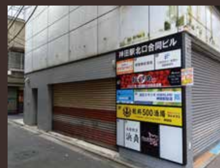
【1階 101号室 平面図】